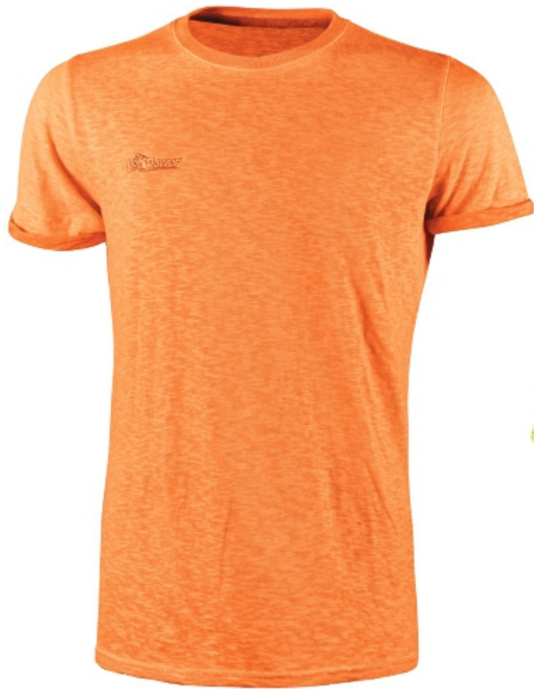
code EY195OF col. ORANGE FLUO