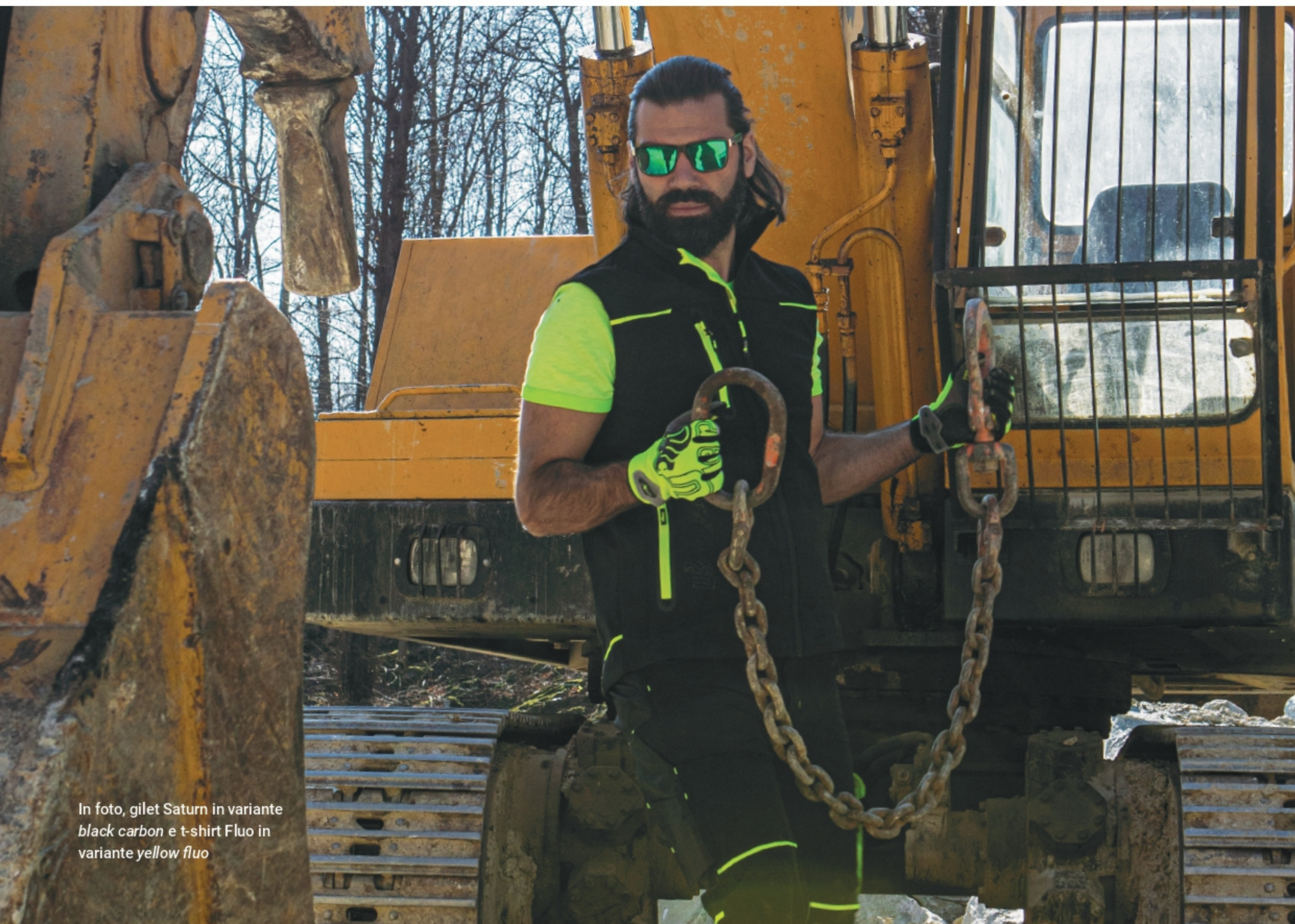
In foto, gilet Saturn in variante black carbon e t-shirt Fluo in variante yellow fluo