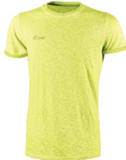
code EY195YF col. YELLOW FLUO