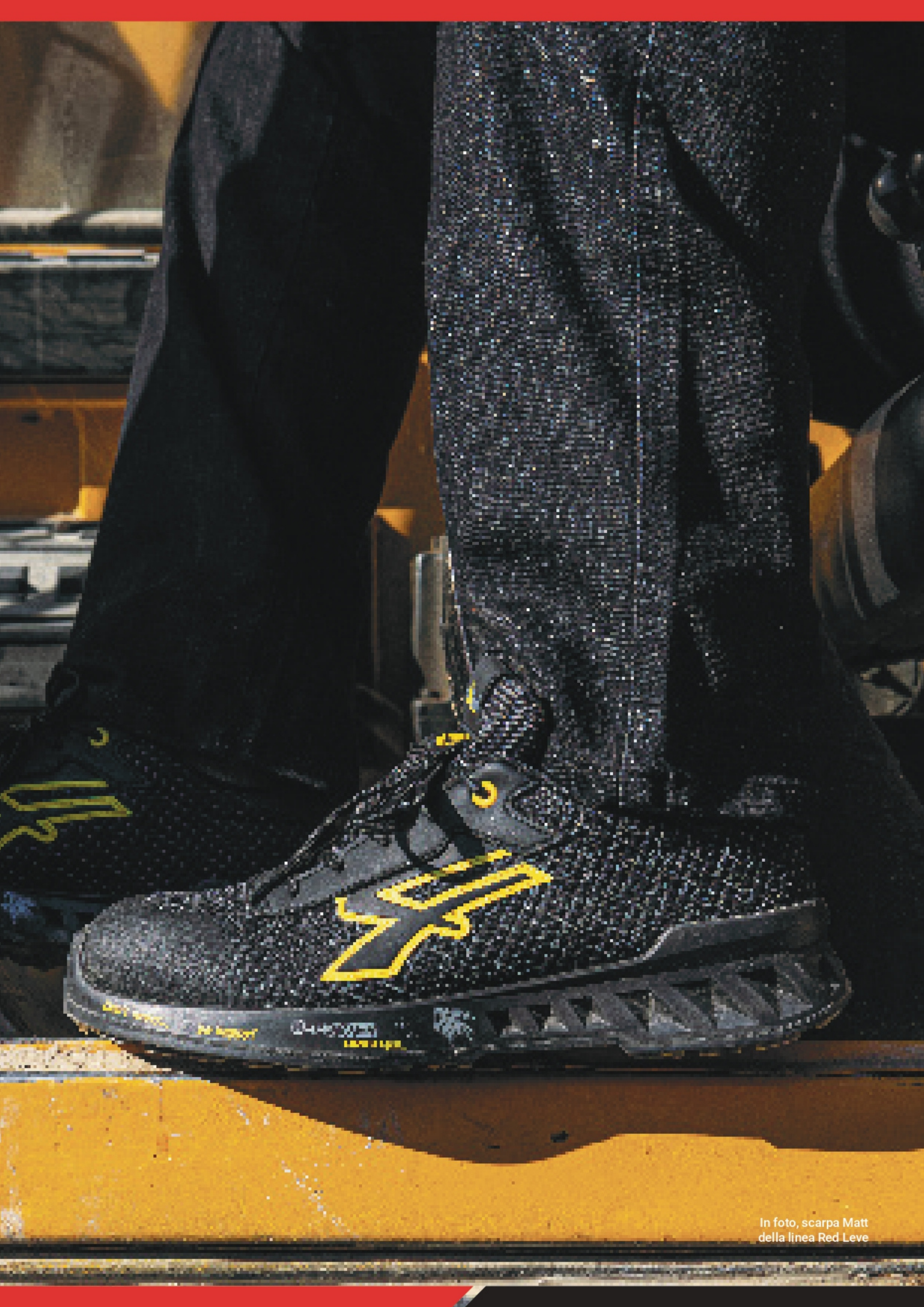
In foto, scarpa Matt della linea Red Leve