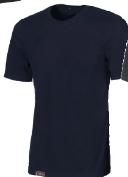
code EY205DB col. DEEP BLUE