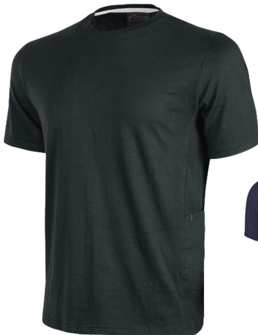
code EY138BC col. BLACK CARBON