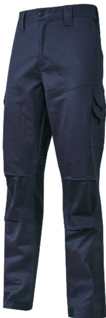
code ST211WB col. WESTLAKE BLUE