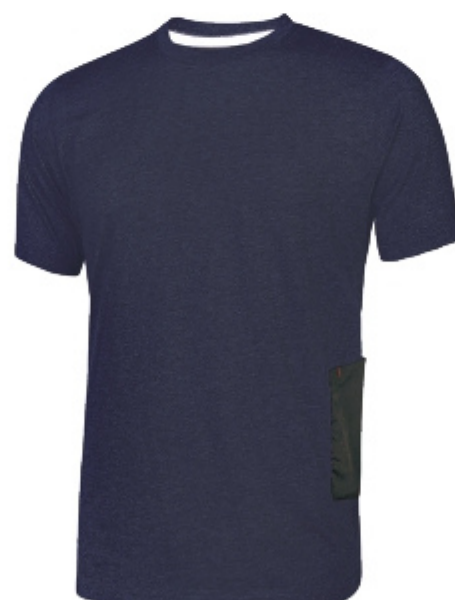
code EY138DB col. DEEP BLUE