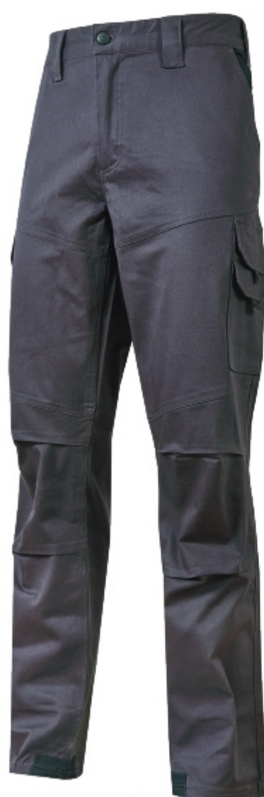
code ST211GI col. GREY IRON