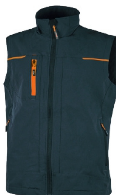
code PE181DB col. DEEP BLUE