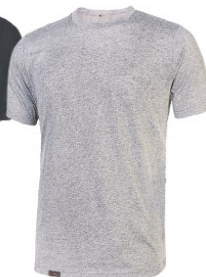
code EY205GS col. GREY SILVER