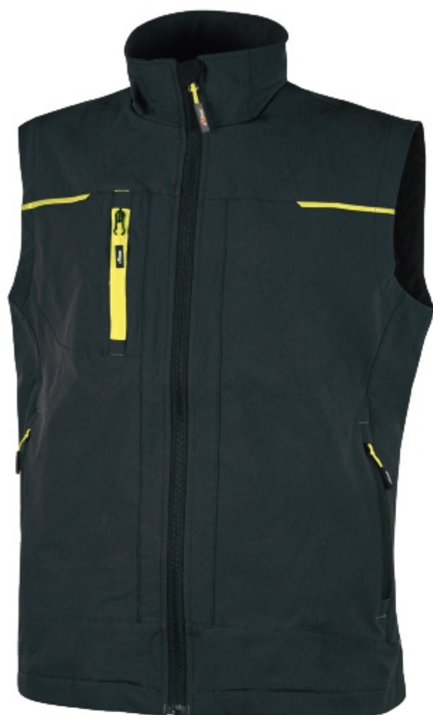
code PE181BC col. BLACK CARBON

»» Gilet in tessuto U-4 (U-Power 4 way stretch) molto comodo, resistente, morbido sulla pelle, idrorepellente, traspirante e asciuga rapidamente.