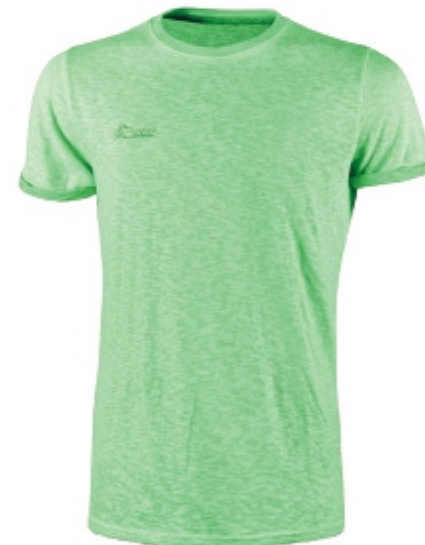
code EY195VF col. VERDE FLUO