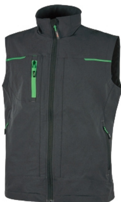
code PE181RL col. ASPHALT GREY GREEN