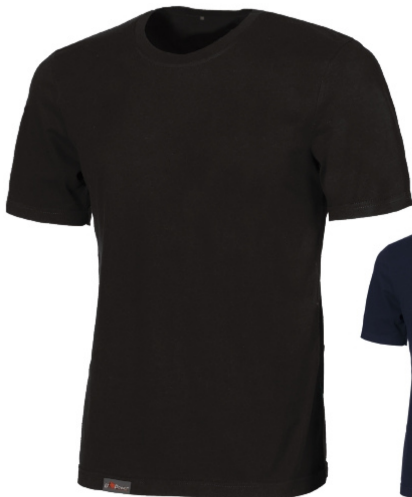
code EY205BC col. BLACK CARBON