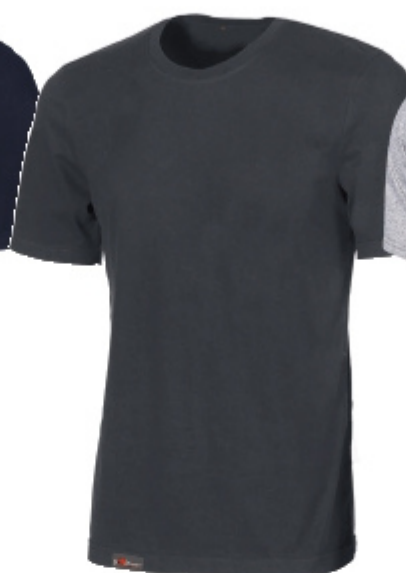
code EY205GM col. GREY METEORITE