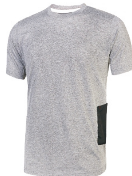
code EY138GS col. GREY SILVER